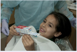
CHẤT LƯỢNG CHĂM SÓC