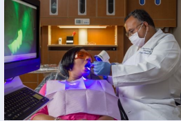
TAY NGHỆ CHUYÊN MÔN CAO