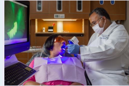
FACULTAD ALTAMENTE CAPACITADA