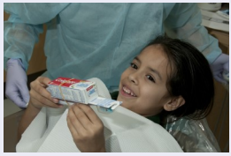
ATENCIÓN DE BUENA CALIDAD PARA EL PACIENTE